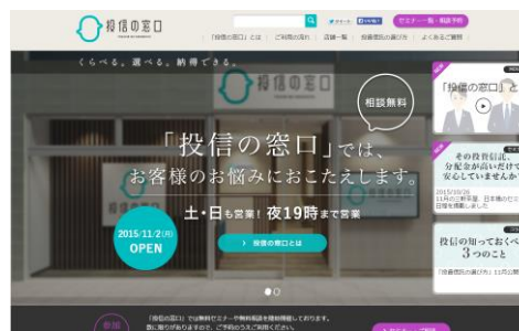
「投信の窓口」公式サイト

<「投信の窓口」公式サイト> http://toushin-no-madoguchi.jp ※公式サイトによるご予約は、2016年4月開始予定。