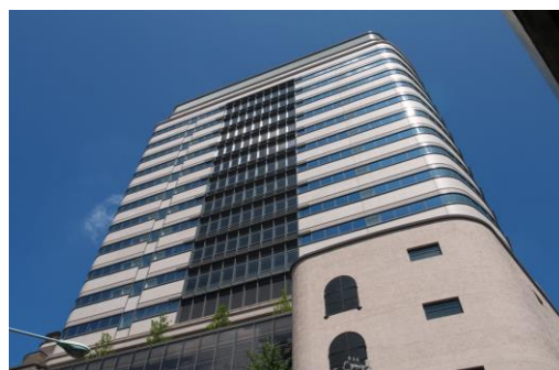
日本橋本店では、毎週末にセミナーを実施しています