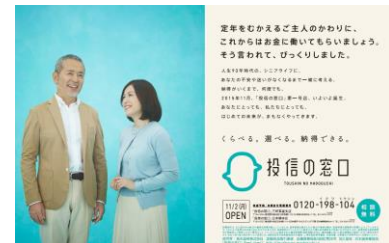
「投信の窓口」交通広告

「投信の窓口」の特長は、これまでの金融業界の中で、扱う投資信託の数が圧倒的に多いこと。国内にあるほぼすべての投資信託を、定量的なデータから客観的に比較検討することができるサービスです。担当者がお勧めする商品だけから選択するのではなく、お客様ご自身の目で、くらべて、見極めて、選ぶことができます。だからこそ、心からの納得が得られる。このことをすべてのお客様に体験していただける、業界ではじめての来店型店舗です。たくさんの選択肢から選べるのが当たり前前の時代だからこそ、投資信託をもっと自由に選べる時代にしたい。そんな想いで、いよいよこの新しいサービスをお客様にお届けできることになりました。